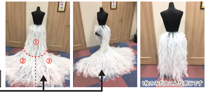
1枚のみだとこんな感じです