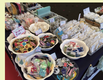
フリカケはパーツ系を沢山並べました。見ていてワクワクしますよね！